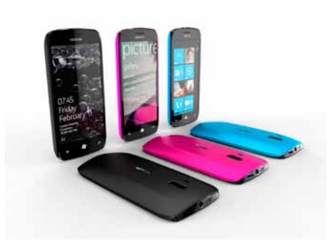
Gestürzter Superstar: Den Anschluss an die Marktentwicklung hat Nokia verpasst. Nokia-Chef Stephen Elop braucht, um einen Fuß in den Smartphone-Markt zu bekommen, eine neue Marke mit einer neuen Idee.

eine neue Art des Wachstumsdenkens: Noch immer glauben viele Unternehmens- und Markenverantwortliche, dass Marken ewig wachsen können. Nur: Dieser Glaube zerbröckelt auf gesättigten Märkten immer mehr an der Realität. Immer mehr große Marken müssen erkennen, dass man trotz aller Bemühungen (neue Produkte, noch mehr Werbung, noch mehr Promotions) froh sein muss, wenn man mit der Inflationsrate wächst. Hier kann es dann enorm sinnvoll sein, selbst neue Wachstumsmarken am Rande zu aufzubauen, bevor es jemand anderer tut.