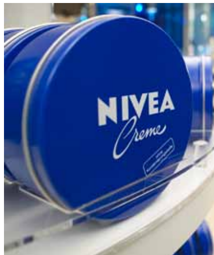
Zurück zu den Wurzeln: Nivea fokussiert sich wieder auf Pflege.

Dafür sind zwei psychologische Phänomene verantwortlich, nämlich der Heiligenschein- oder Halo-Effekt und der Generalisten-Effekt. Dabei wirken diese Effekte nicht parallel, sondern zeitversetzt. Nehmen Sie Blend-a-med! Früher war Blend-a-med die Zahnpasta gegen Zahnausfall. Noch heute können sich viele Menschen an den Slogan „Damit Sie auch morgen noch kraftvoll zubeißen können“ erinnern. Auch das Schlüsselbild vom Apfel, einmal mit